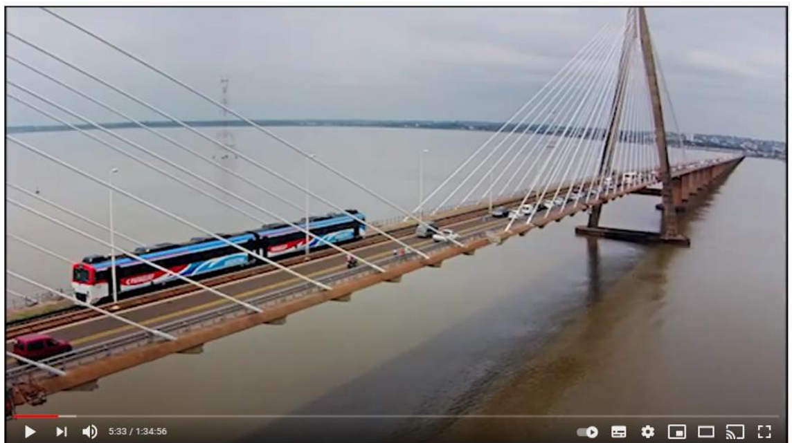
Imagen 1: captura del video de YouTube de la obra Asimetrías animadas de ayer y hoy 2018

RULO ESPINOLA Asimetrías Animadas de ayer y hoy (Show Completo 2017 HD)