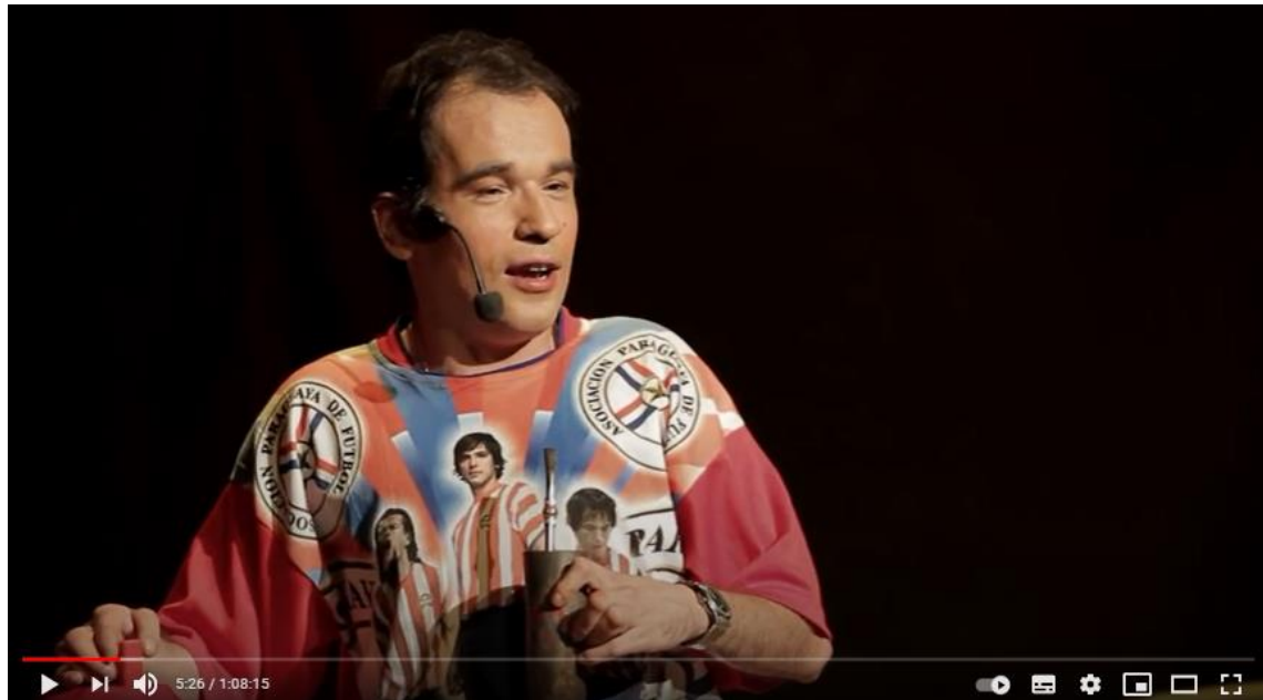
Imagen A: captura del video de YouTube de la obra: ¿Por qué hace eso? 2017

La vestimenta (Imagen A), por su parte, connota a través del color el nacionalismo del personaje, lo que se enfatiza con elementos como su inseparable equipo de tereré que corresponde a una costumbre local, muy común, de beber esta infusión fría en cualquier momento del día, la cual está asociada a momentos de ocio y por eso connota holgazanería. De ahí que, la composición física del personaje connota la idea de un sujeto chabacano y sencillo, aunque dinámico, predispuesto y hábil.