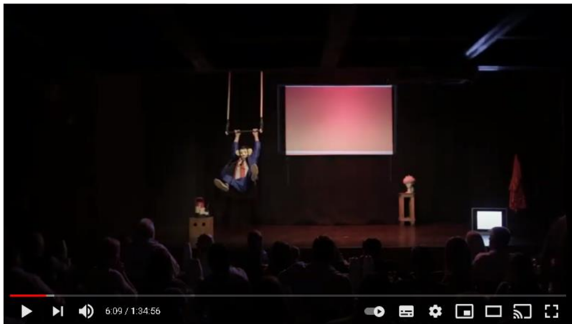
Imagen C: captura del registro en video de YouTube de la obra Asimetrías Animadas de ayer y hoy 2018

El personaje, que lleva puesto su típico atuendo y una careta de mono, enseguida se yergue frente al público, se saca la máscara y saluda diciendo: “buenas noches América”, seguido agrega “bienvenidos a esta noche en la que nos vamos a ‘desmonizar’, es decir a dejar de ser monos por un rato”.