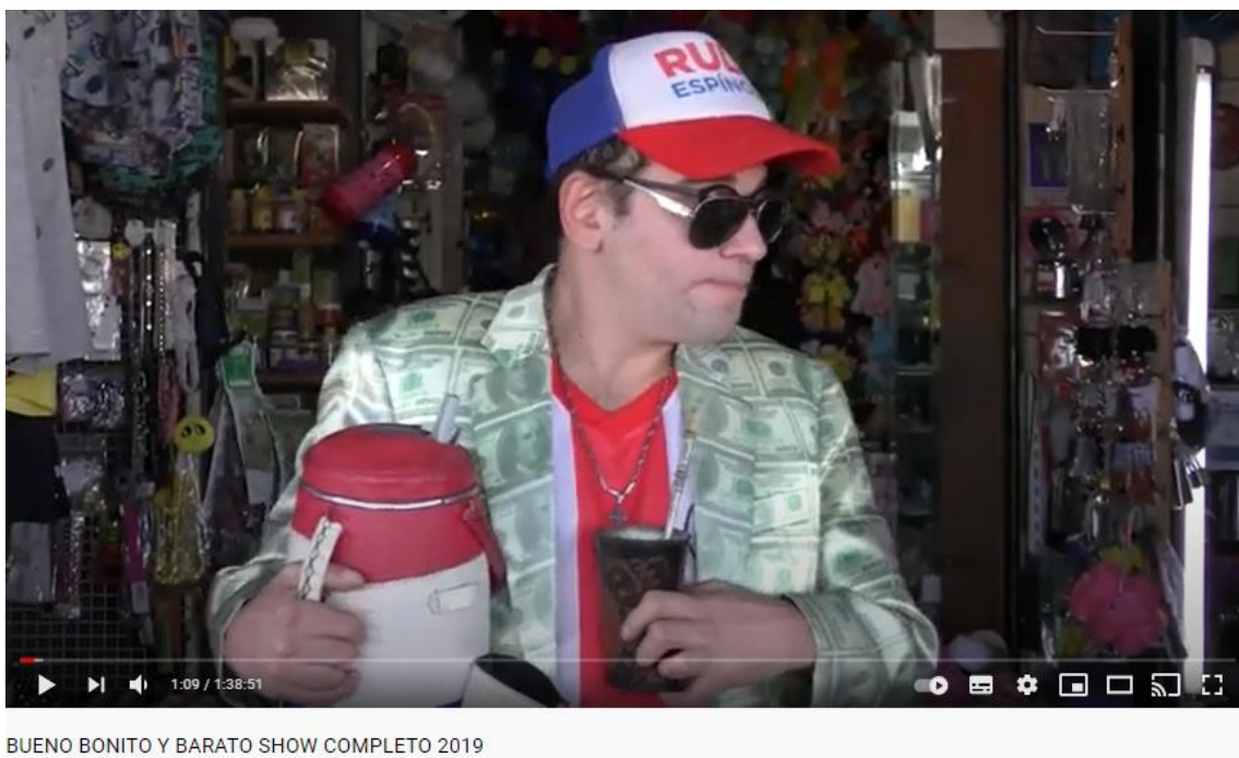
Imagen 1: captura del video de YouTube de la obra Bueno, Bonito y Barato 2020

A lo largo del show, la escena no presenta grandes cambios de iluminación, desde que se encienden las luces, toda la puesta está completamente iluminada, y el personaje, se desplaza por todo el escenario interactuando con la pantalla y las cajas, de las que en más de una oportunidad saca elementos de sus interiores, como por ejemplo un equipo de tereré o un sillón. Ya llegando al final del espectáculo, sí se produce un cambio en las luminarias, quedando la sala en penumbra, debido a que el actor sale de personaje y comenta cómo surgió Rulo Espínola .