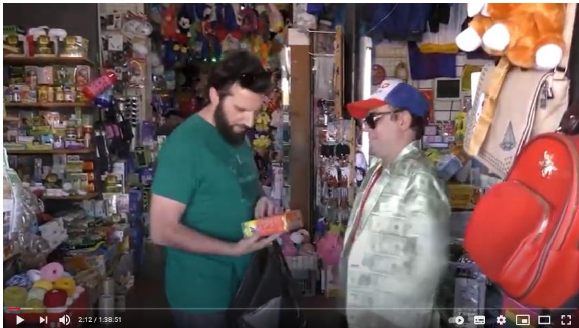
Imagen E captura del video de YouTube de la obra: Bueno, bonito y barato 2020

— ¡Ay, qué quebranto! Este curepa cheraá, quiere pagar con tarjeta si su plata no vale nada, ¡ay, deja nomás quebranto nomá!