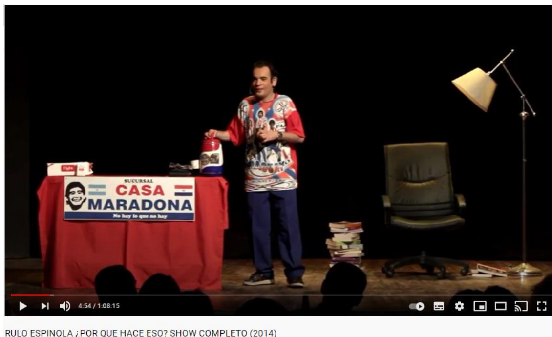
Imagen 2: captura del video de YouTube de la obra ¿Por qué hace eso? 2017