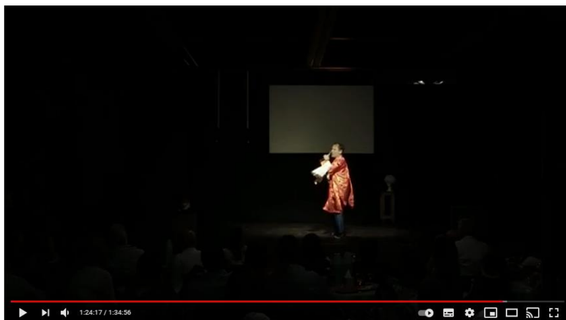
Imagen 5: captura del video de YouTube de la obra Asimetrías animadas de ayer y hoy 2018

RULO ESPINOLA Asimetrías Animadas de ayer y hoy (Show Completo 2017 HD)