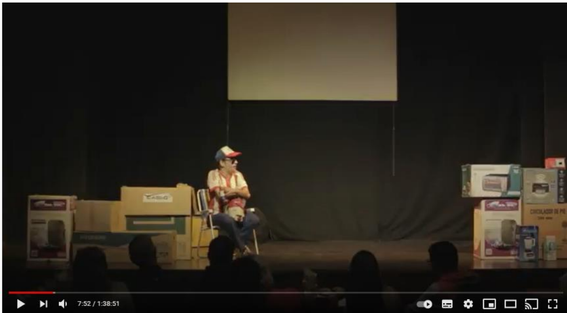
BUENO BONITO Y BARATO SHOW COMPLETO 2019