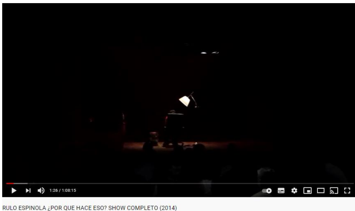
Imagen 1: captura del video de YouTube de la obra ¿Por qué hace eso? 2017

sentado en la silla y por otros de pie desplazándose de un lado a otro del espacio, el cual está delimitado por los elementos de la escena y las luminarias. (Imagen 2).