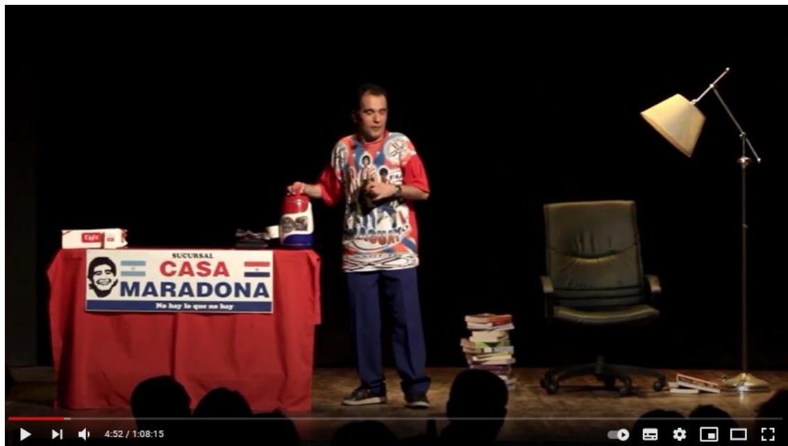
Imagen B: captura del video de YouTube de la obra: ¿Por qué hace eso? 2017

Así pues, los elementos que constituyen la escenografía no son simplemente objetos aleatorios dispuestos en la escena, sino que corresponden al mobiliario del lugar en el que se encuentra el personaje. Por ejemplo en: ¿Por qué hace eso? (imagen B) el espectador, al ver la mesa con el cartel de Casa Maradona y el atado de cigarrillo, interpreta que Rulo está en su puesto de venta. A la vez, el discurso más la vestimenta y su equipo de tereré ayudan a la caracterización de este pasero paraguayo.