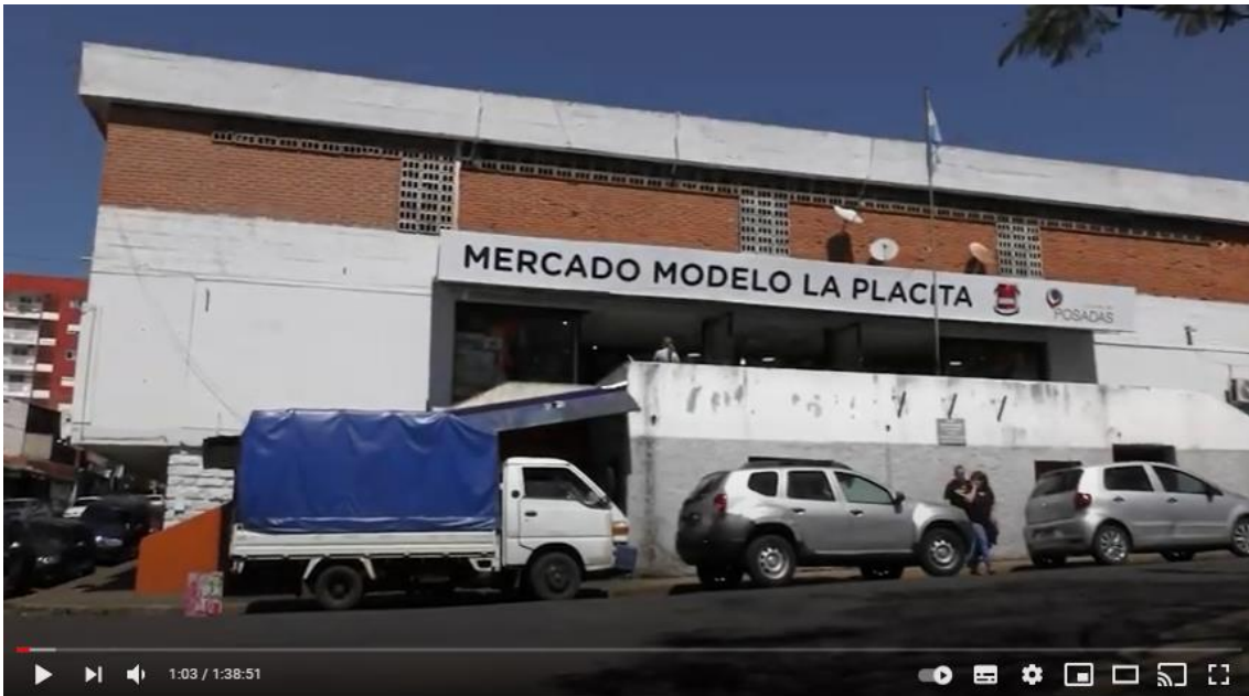
BUENO BONITO Y BARATO SHOW COMPLETO 2019