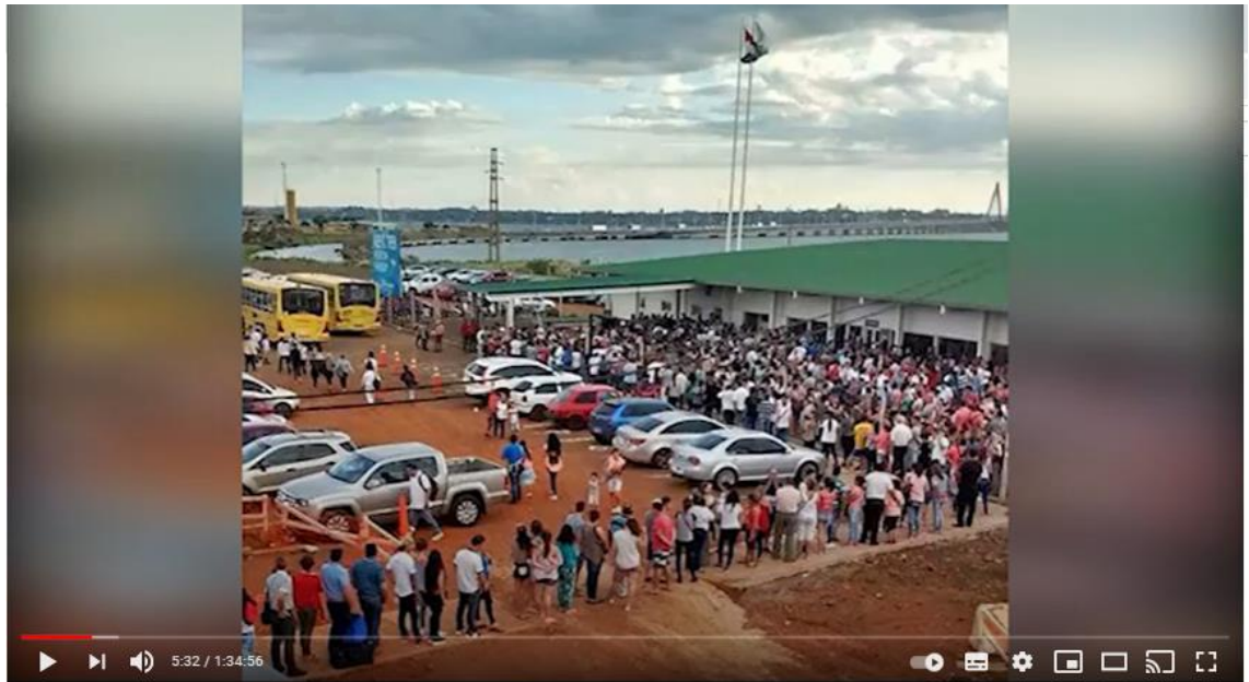
RULO ESPINOLA Asimetrías Animadas de ayer y hoy (Show Completo 2017 HD)