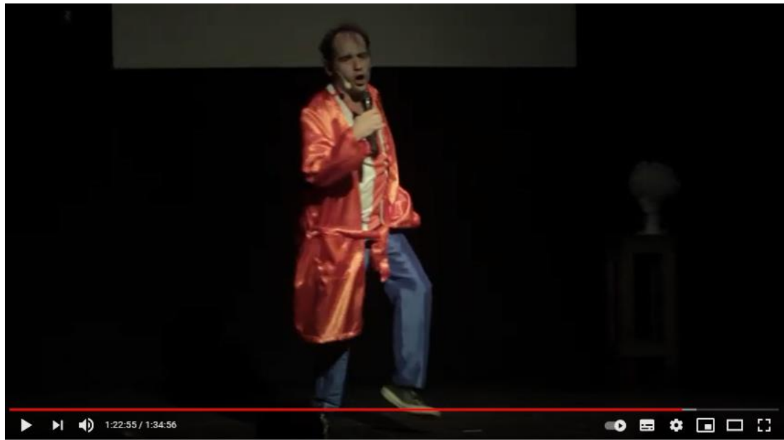
Imagen D: captura del video de YouTube de la obra: Asimetrías Animadas de ayer y hoy 2018

van a comprar a Encarnación. A su vez, mediante este recurso, el actor logra enfatizar las diferentes personalidades de estos sujetos enmarcados dentro de una misma cultura, pero con esencias diferentes.