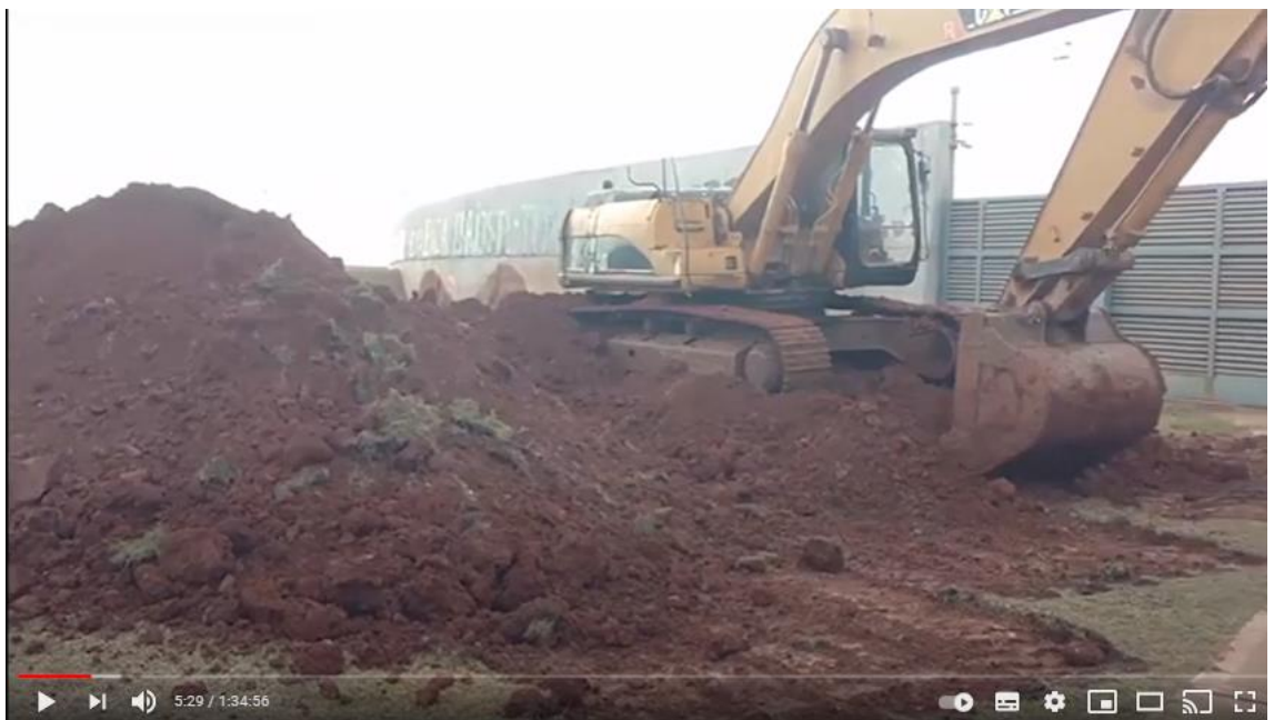
RULO ESPINOLA Asimetrías Animadas de ayer y hoy (Show Completo 2017 HD)