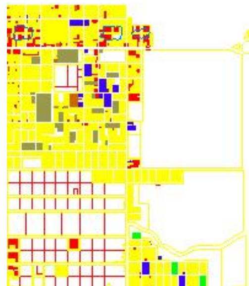
Área periférica de Barranqueras