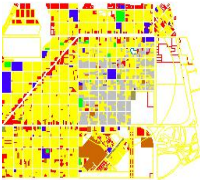
Área consolidada central de Barranqueras