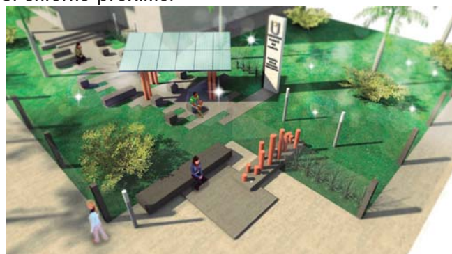
Figura 2: Perspectiva del sector.

En la figuras 2 se muestra una de las imágenes a nivel de anteproyecto, en los que se observa la propuesta integradora del campus con el entorno próximo.