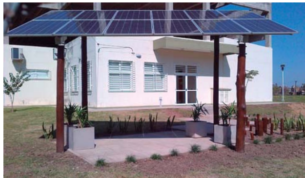
Figura 6: fotografía de la cubierta solar con la propuesta paisajística con especies altamente resistentes al clima muy cálido de la región.

La Municipalidad de la Ciudad de Resistencia, que apoyó esta iniciativa, a través de su Dirección de Paseos y Jardines, proveyó las especies y la mano de obra para la concreción de la propuesta paisajística (figura 6).