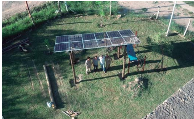
Figura 3: Fotografía de la cubierta solar en su proceso constructivo.

El arreglo se encuentra apoyado sobre una estructura de perfiles de chapa en voladizo y las columnas se materializan reutilizando troncos acopiados en el terreno. La madera resulta un material orgánico, sustentable, cuya producción y transformación requiere de mucha menos energía e impactos ambientales que otros materiales usados habitualmente (hormigón armado o metal). A su vez, desde el punto de vista estético se trabaja con el contraste entre lo muy pulido (paneles fotovoltaicos) en contraposición a la rusticidad de las columnas de madera.