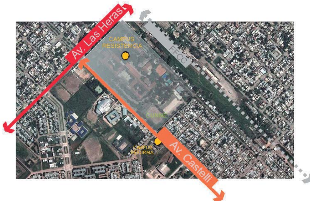
Figura 1. Implantación del Campus Resistencia y Campus de la Reforma Universitaria de la Universidad Nacional del Nordeste en la trama urbana de la ciudad de Resistencia.

Luego de la definición del lugar de implantación se inició la etapa de definición de pautas y toma de partido. Entre las principales pautas se destaca: