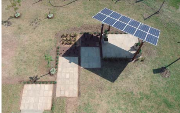
Figura 5: fotografía aérea en la que se observa el diseño del espacio exterior de la cubierta solar.

un pequeño edificio que estaba ubicado dentro del predio.