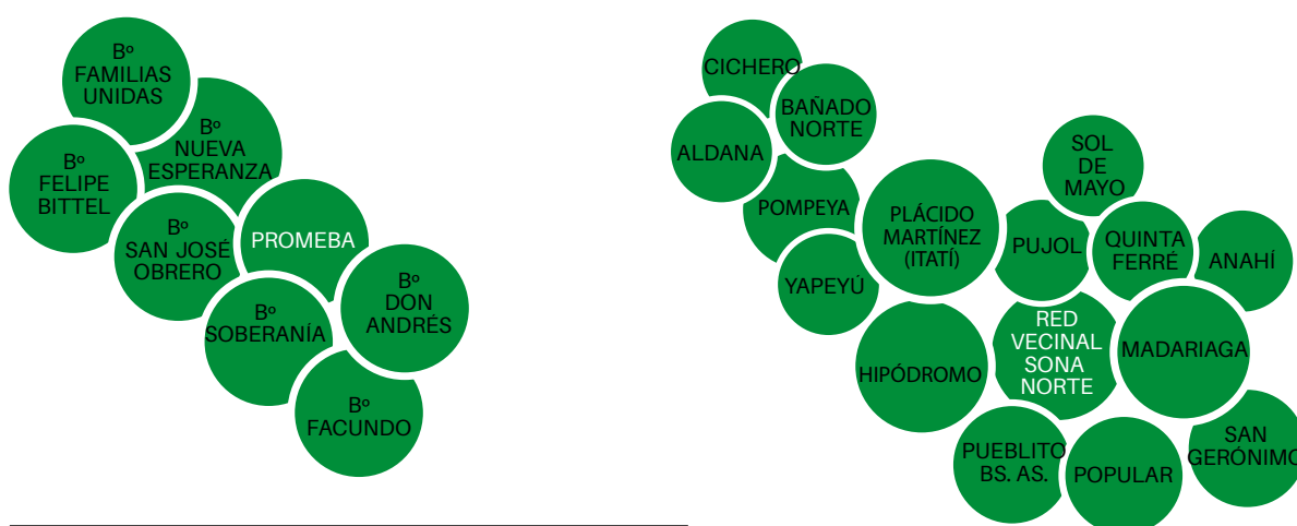
Figura 2. Esquema de los barrios que conforman las distintas intervenciones, los que fueron parte del programa nacional Promeba en Resistencia y los que integran la Red Vecinal Zona Norte en Corrientes. Elaboración propia sobre la base de información primaria (trabajo de campo)

Durante el proceso se acudió a distintas instancias comunitarias de diagnóstico, propuesta y validación en cada una de las siete chacras donde se realizó la intervención, que decantaron en la mesa de área sur , como instancia de representación de los vecinos para el acompañamiento del proyecto. A su vez, cada intervención territorial promovió la creación de espacios o mesas de participación comunitaria a escala barrial para acompañar la ejecución. Estos espacios introdujeron demandas propias y específicas. La mesa de área se mantuvo muy activa especialmente durante la primera etapa, en la cual se constituyó como organización.