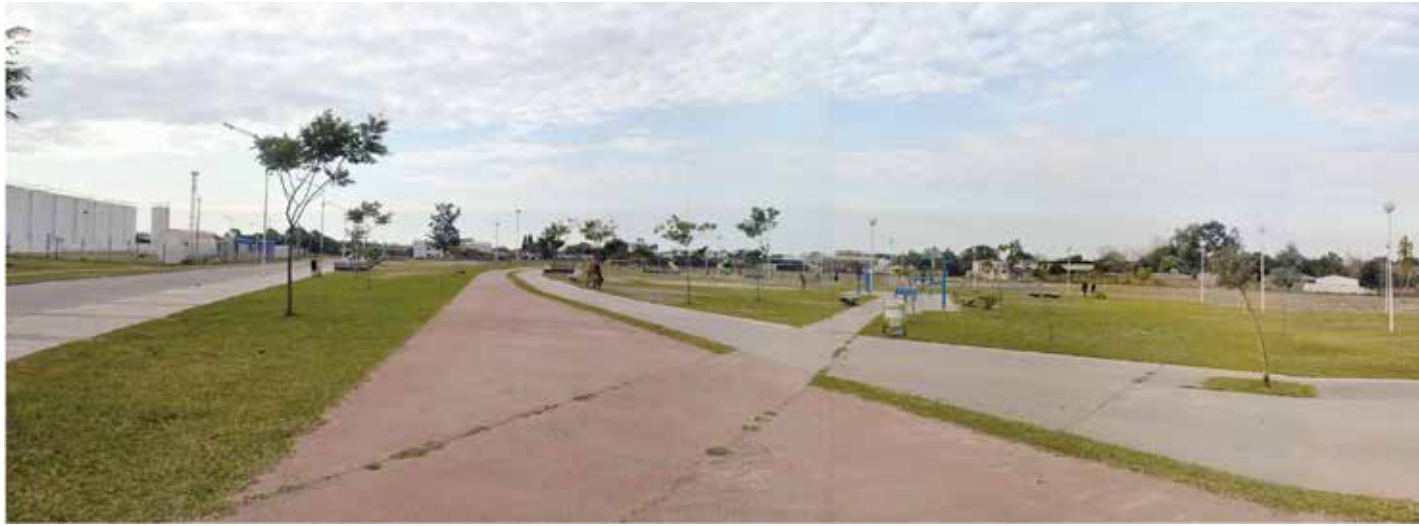
Figura 7. Perspectiva general del Parque Hipódromo, Corrientes. Elaboración propia sobre la base de información primaria (trabajo de campo)