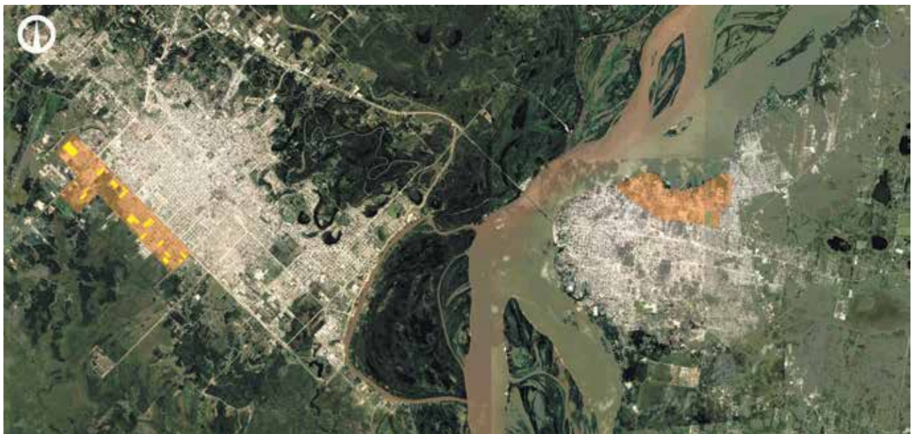
Figura 1. Conglomerado urbano conformado por las ciudades capitalinas de Resistencia y Corrientes. Ubicación de los sectores analizados denominados Área Sur y Zona Norte, respectivamente. Elaboración propia sobre la base de imágenes satelitales gratuitas de Google Earth

Se seleccionaron dos casos de estudio, del medio regional, situados en las ciudades de Resistencia y Corrientes. Los criterios que primaron