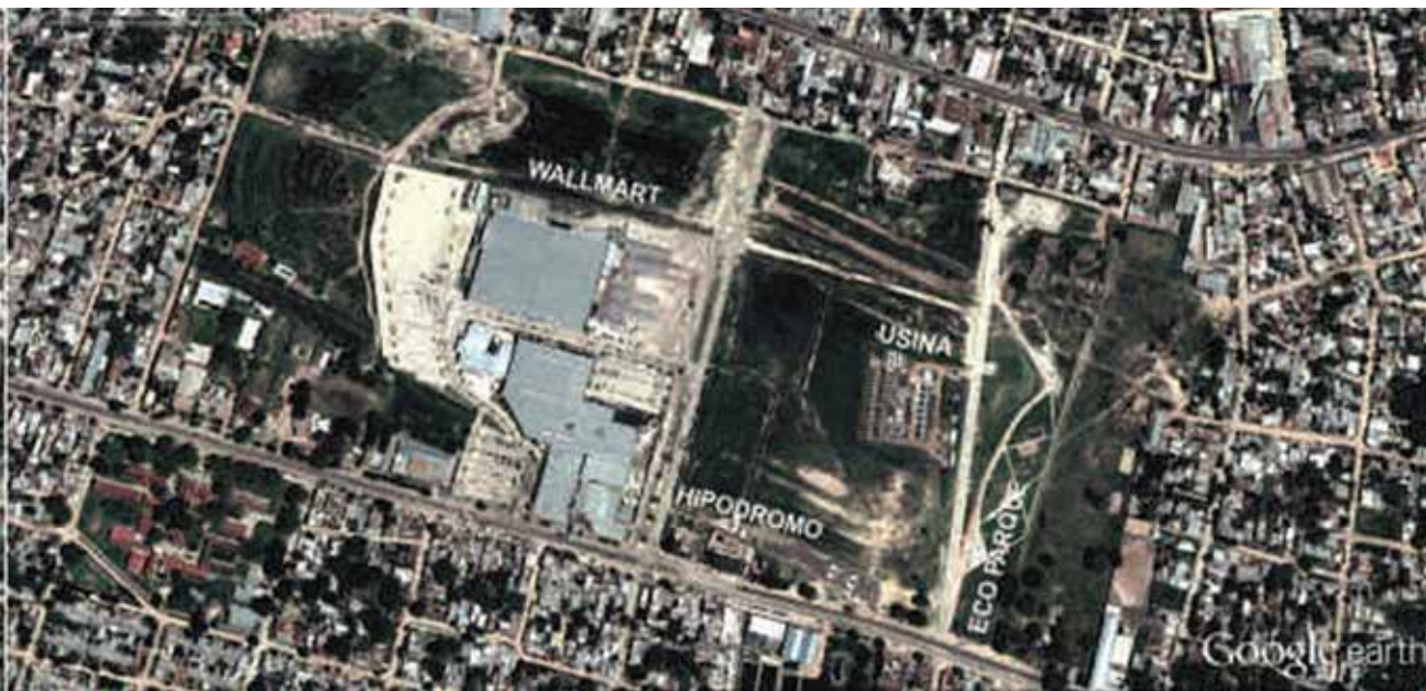
Figura 6. Imágenes satelitales de los años 2002 y 2016, respectivamente, del sitio que abarcaba el Hipódromo inicialmente y la subdivisión del predio en la actualidad. Ubicación y entorno inmediato del Eco Parque, Corrientes. Elaboración propia sobre la base de imágenes satelitales gratuitas de Google Earth

dientessu ampliación, mantenimiento adecuado y la gestión asociada. Entre los reclamos vecinales, continúa el mejoramiento integral de la zona y la demanda para que se retire de un predio adyacente una central eléctrica instalada por el gobierno provincial en 2010, sin estudio de impacto ambiental y con el compromiso no cumplido de que iba a ser provisoria.