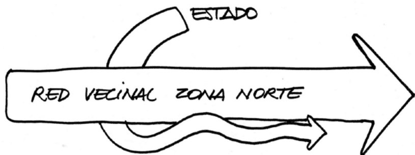
Figura 8. Esquema proceso participativo Red Vecinal Zona Norte. Elaboración propia

De este modo, si bien el funcionamiento orgánico de la red (sistema de plenario más comisión directiva) no implica una estructura totalmente horizontal, los liderazgos no absorbieron las particularidades y aportes específicos de sus distintos integrantes. El reconocimiento-pertenencia y apropiación de los vecinos (y otros que al no serlo directamente se “sintieron” vecinos)