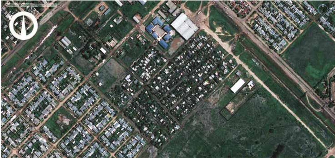
Figura 3. Imágenes satelitales de los años 2009 y 2016, luego de la intervención del programa, del sector conformado por los barrios Familias Unidas, Nueva Esperanza y Felipe Bittel del Área Sur, Resistencia. Elaboración propia sobre la base de imágenes satelitales gratuitas de Google Earth