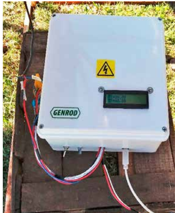
Figura 2: Dispositivo de adquisición de datos