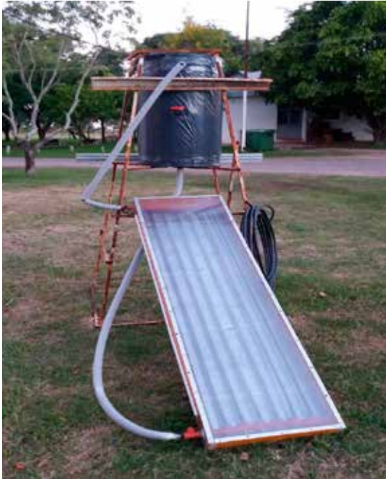
Figura 1: Colector construido.

pone de un protocolo de almacenamiento y transmisión de datos por vía wifi, lo que permite monitorear el funcionamiento del sistema ( figura 2 ).