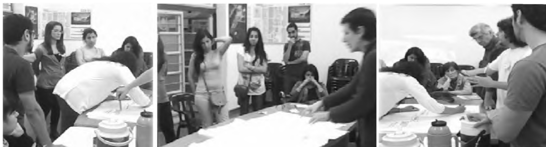
Reuniones Interdisciplinarias de trabajo en gabinete FAU - UNNE