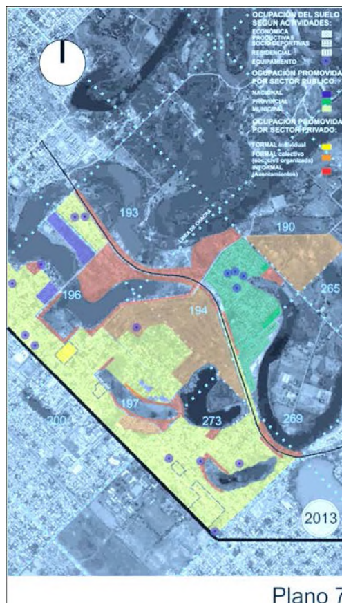
Gráfico 4. AUDC Golf Club. Conformación del territorio 2013

Una segunda etapa, luego de la sanción de la Ley Nacional N.º 14037 de provincialización de los Territorios de Chaco y La Pampa, la conformación del territorio se caracterizó principalmente por la actividad residencial y deportiva. Los distintos momentos de urbanización en esta etapa estuvieron condicionados por factores ambientales, como las grandes inundaciones de 1966, 1982, 1998 y las distintas situaciones político-institucionales, tales como la creación del FONAVI a finales de los años 70, con la construcción de grandes conjuntos habitacionales y la crisis político-institucional del año 2001, caracterizada por un incremento notable de asentamientos informales en terrenos públicos y privados. Actualmente, el área en estudio es un territorio completamente ocupado, principalmente para uso residencial y en segundo término para uso recreativo/deportivo, de una gran heterogeneidad socioeconómica, pero hacia su interior con sectores de homogeneidades identificables.