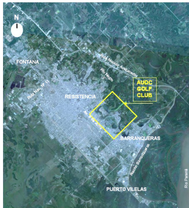
Fuente: elaboración propia sobre imagen Google Earth 2014