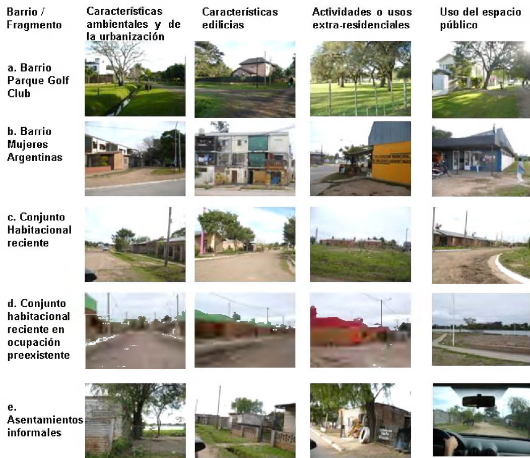
Gráfico 5. AUDC Golf Club. Características de los distintos barrios

Fuente: imágenes propias, equipo de investigación IIDVI. Junio a octubre de 2013