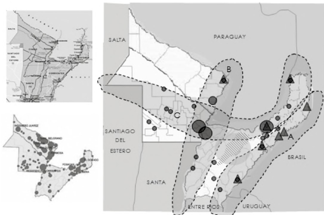
Figura 1. Diagnóstico de ejes regionales. Grupo N.º 9, ciclo 2015. Díaz de Vivar, Iturriga, Zonza

Ciclo 2013: en este primer año, se tomó la región NEA como un todo multidimensional donde el área de intervención urbana y arquitectónica incluía sus capitales, vistas como posibles nodos de desarrollo regional, y fue tomada como tema de análisis. El área de intervención urbana y arquitectónica incluía sus capitales, vistas como posibles nodos de desarrollo regional. En esta oportunidad los alumnos debieron desarrollar un diagnóstico y una propuesta de escala regional, y un diagnóstico y propuesta urbana en alguna de las capitales de las provincias integrantes de la Región NEA (Formosa, Resistencia, Corrientes y Posadas). Cada grupo podía optar por la ciudad que le resultara más afín.