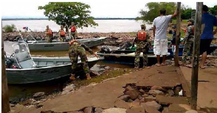
Imagen 3. La armada paraguaya descendió en la isla en 2016 y secuestró una embarcación argentina aludiendo que pescaba en aguas paraguayas violando tratados internacionales.