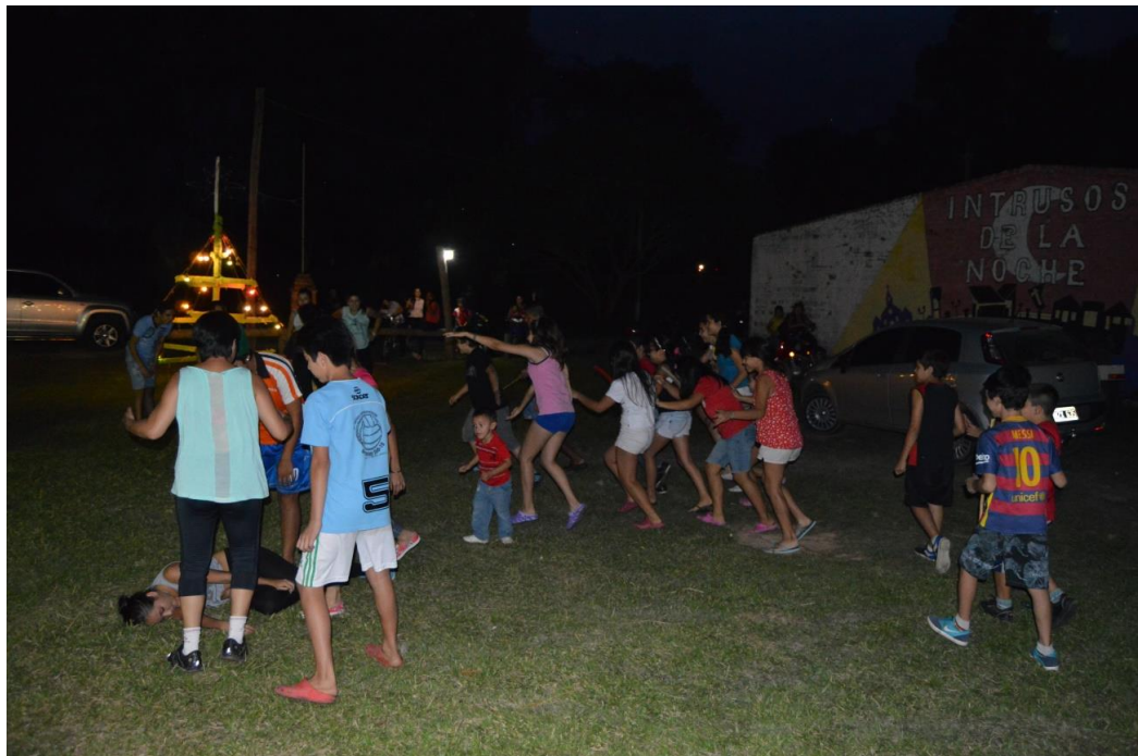
Foto 2: Ensayo de show. Fotografía tomada por Melisa Skarp (2016)