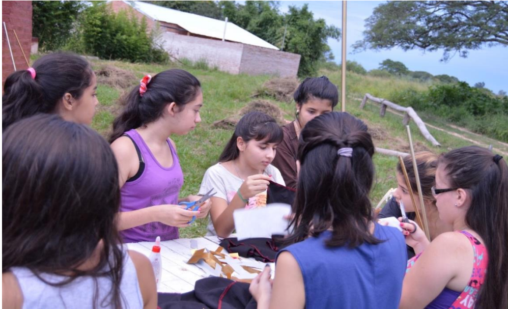
Foto 1: Confección de trajes.