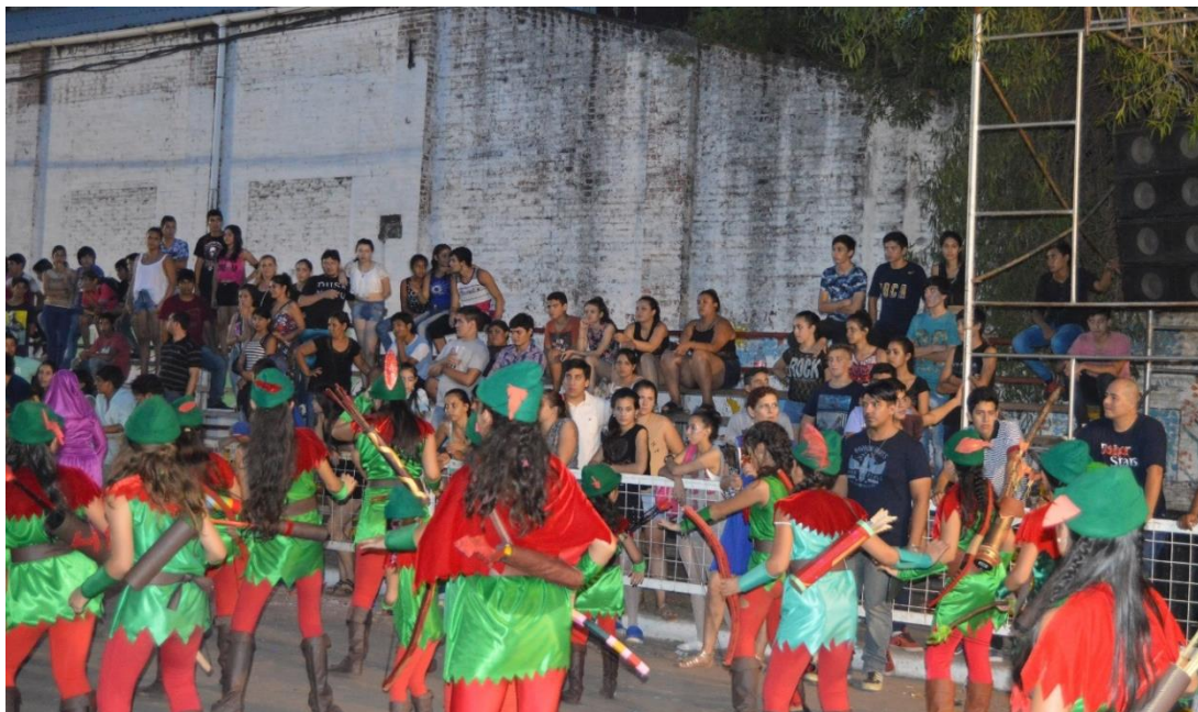
Foto 3 Presentación de “Intrusos de la Noche”. Carnaval Puerto Tirol.